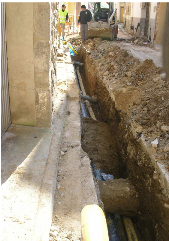
foto: Les obres al Carrer del riu

Paral·lelament, s'ha aprofitat l'obertura de rases per part de l'empresa del gas per instal·lar igualment la xarxa de subministrament d'aigua potable al Carrer del Riu i d'altres adjacents