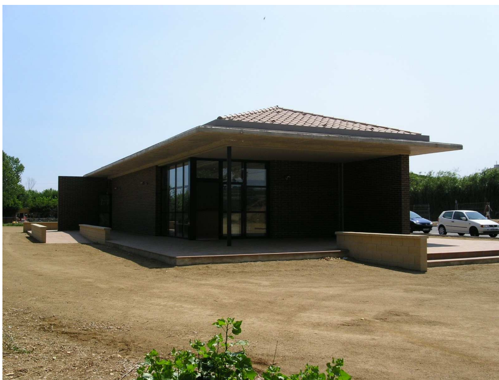
El Centre d'Informació, un cop acabat

El desenvolupament de la darrera temporada estiuenca va venir marcada, pel que fa als serveis i usos de la platja, per la posta en marxa de dues àrees específicament adreçades a la pràctica de l'esport de flysurf o kitesurf . D'aquesta manera, s'ha pogut passar de la prohibició absoluta dels anys anteriors a una experiència pilot que, en línies generals, ha resultat bastant satisfactòria. La gestió d'ambdues àrees per a la pràctica del kitesurf fou adjudicada a l' Associació de Càmpings de Sant Pere Pescador , la qual es feu càrrec igualment del pagament de les despeses de contractació d'un vigilant per a la platja i d'un vehicle quad per al seu desplaçament al llarg d'aquesta.